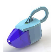
過去の学生の作品例（設計は一見簡単そうで大変なものです）